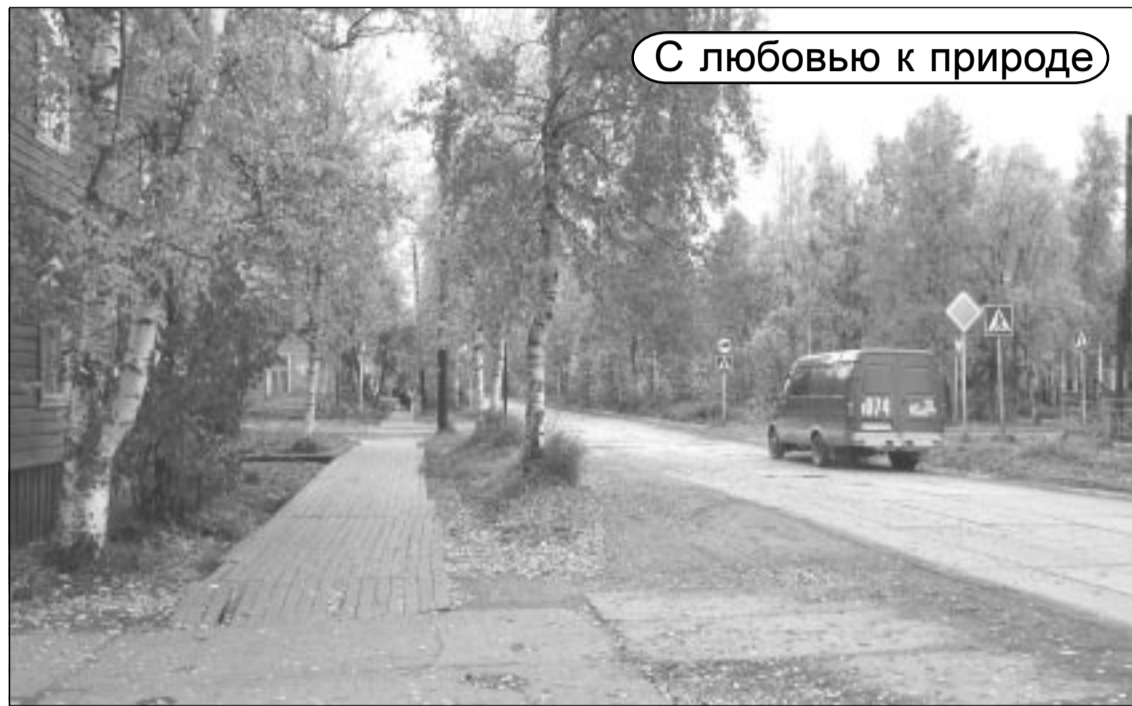
С любовью к природе